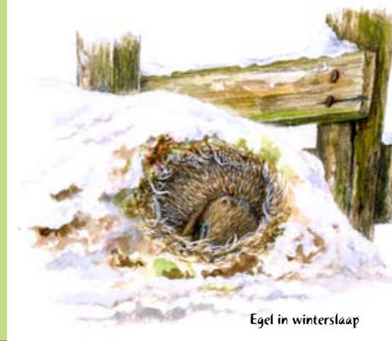
Egel in winterslaap