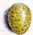
Roodborsteitje ware grootte

Het mannetje zingt ook om een vrouwtje te verleiden. Dat doet hij vooral in het vroege voorjaar. Als een vrouwtje op hem valt omdat hij zo prachtig kan zingen, gaan ze samen een nestje bouwen. Er worden ongeveer zes eieren gelegd. De jonge roodborstjes hebben zachte donsveertjes. Die zorgen ervoor dat ze lekker warm blijven. De veertjes op de borst zijn nog niet oranje, maar lichtbruin met een donkerbruine bovenkant.